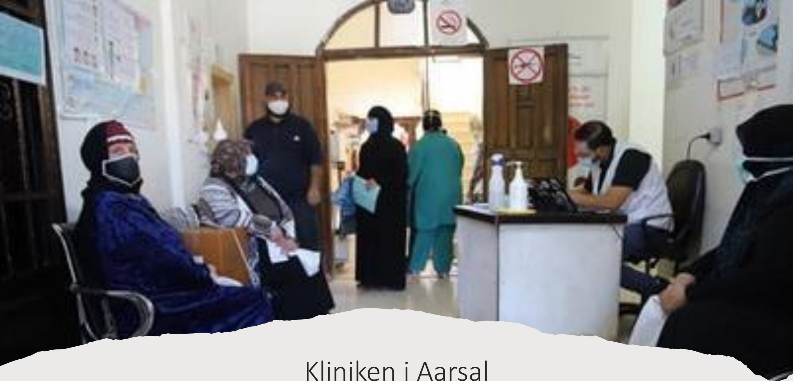
Kliniken i Aarsal